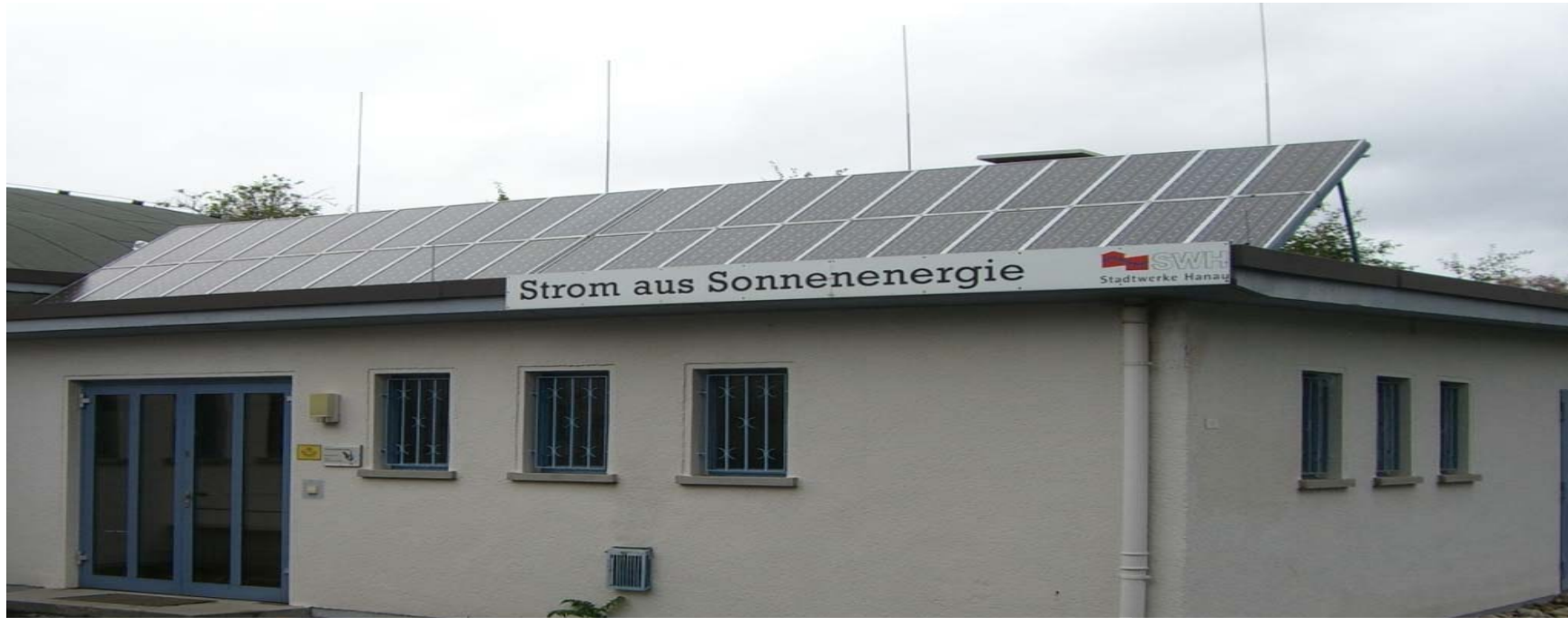
PV Anlage SWH Wasserwerk 2,2 kW peak : Ertrag kWh/Einsparung CO 2 in kg