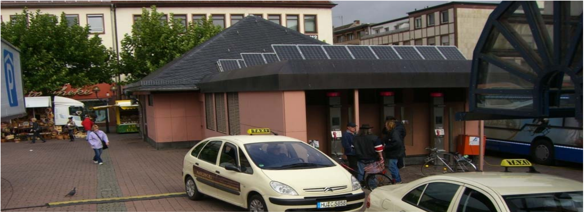
PV Anlage SWH Marktplatz 2,64 kW peak : Ertrag kWh/Einsparung CO 2 in kg