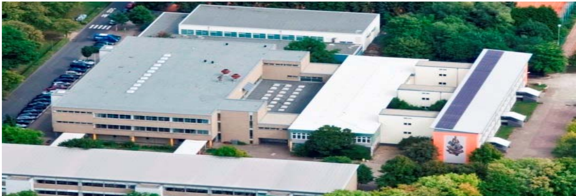
Bürgersolaranlage PV Anlage Lindenausschule 13,5 kW peak : Ertrag kWh/CO 2 Einsparung in kg