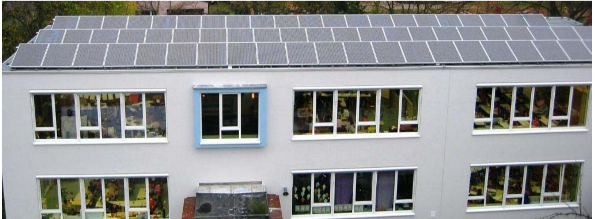
PV Anlage Eichendorfschule 21,84 kW peak : Ertrag kWh/Einsparung CO 2 in kg