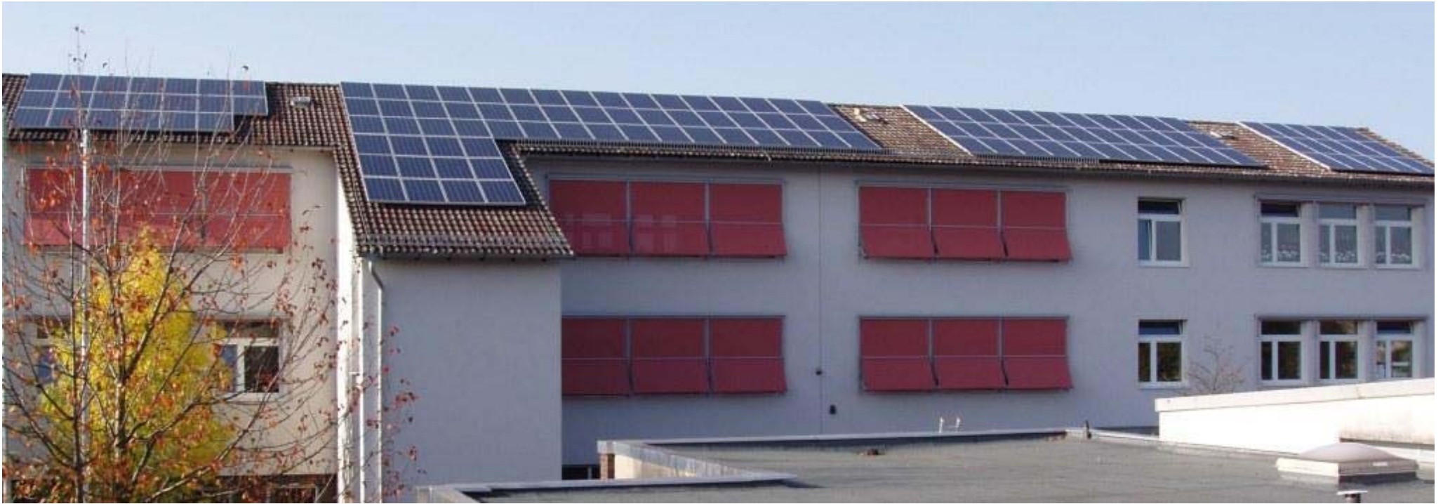
PV Anlage Anne-Frank-Schule 22,12 kW peak : Ertrag kWh/CO 2 Einsparung in kg