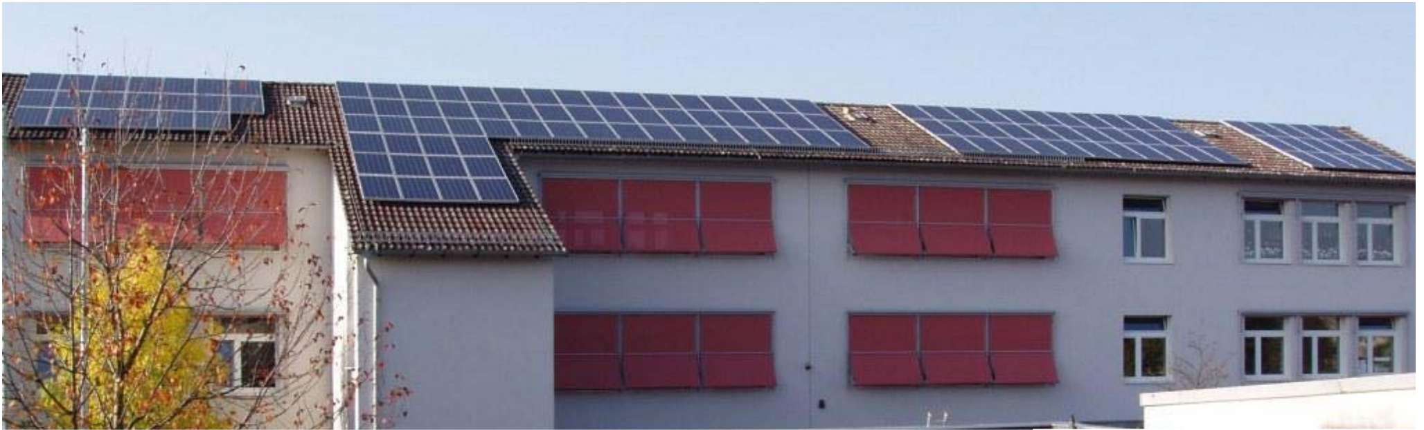
PV Anlage Anne-Frank-Schule 22,12 kW peak : Ertrag kWh/CO 2 Einsparung in kg